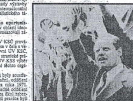
Rok 1971 - na normalizovaných prvomájových „veselících“ se už zase začínalo jít na počest strany a vlády, zatímco na stranických sekretariátech se pomalu připravovala systematická perzekuce tisíců „exponátů pravice“.

Z obsahu materiálu však vyplývá, že seznamy byly uzavřeny až v roce 1973. Během let 1971 a 1973 bylo postupně k evidenci navrženo 10 504 osoby. Nakonec bylo evidováno 6 335 osob. Z předložených materiálů však nevyplývá, zda byly seznamy v následujících letech aktualizovány. V materiálech je též konstatováno, že „největším“ problémem bylo uvolňování výchovných pracovníků (učitelů, docentů, asistentů, profesorů apod.) škol všech stupňů. Většina z nich byla přeznačena z vedoucích a řídicích funkcí do nižších funkcí, ale nadále působili ve výchovném procesu, jejich postupně z školních služeb naráželo na